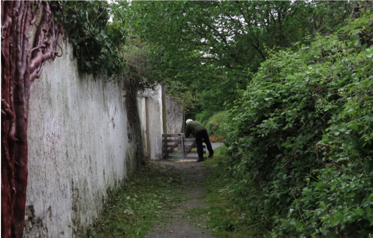
Site des murs à pêches, Montreuil.

« Ce site fait partie intégrante du patrimoine de Montreuil, mais il reste très peu connu aujourd'hui ». Hugo, l'un des membres de l'association Murs à pêches (MAP), qui organise ce week-end la 16e édition du festival dédié à ce lieu surprenant, joue les guides ce mardi après-midi.