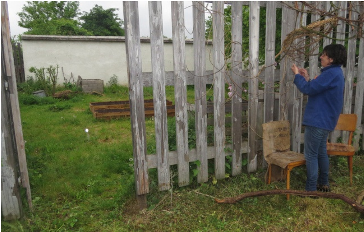
Opération de land art pour accueillir la festival du 13 au 15 mai 2016.