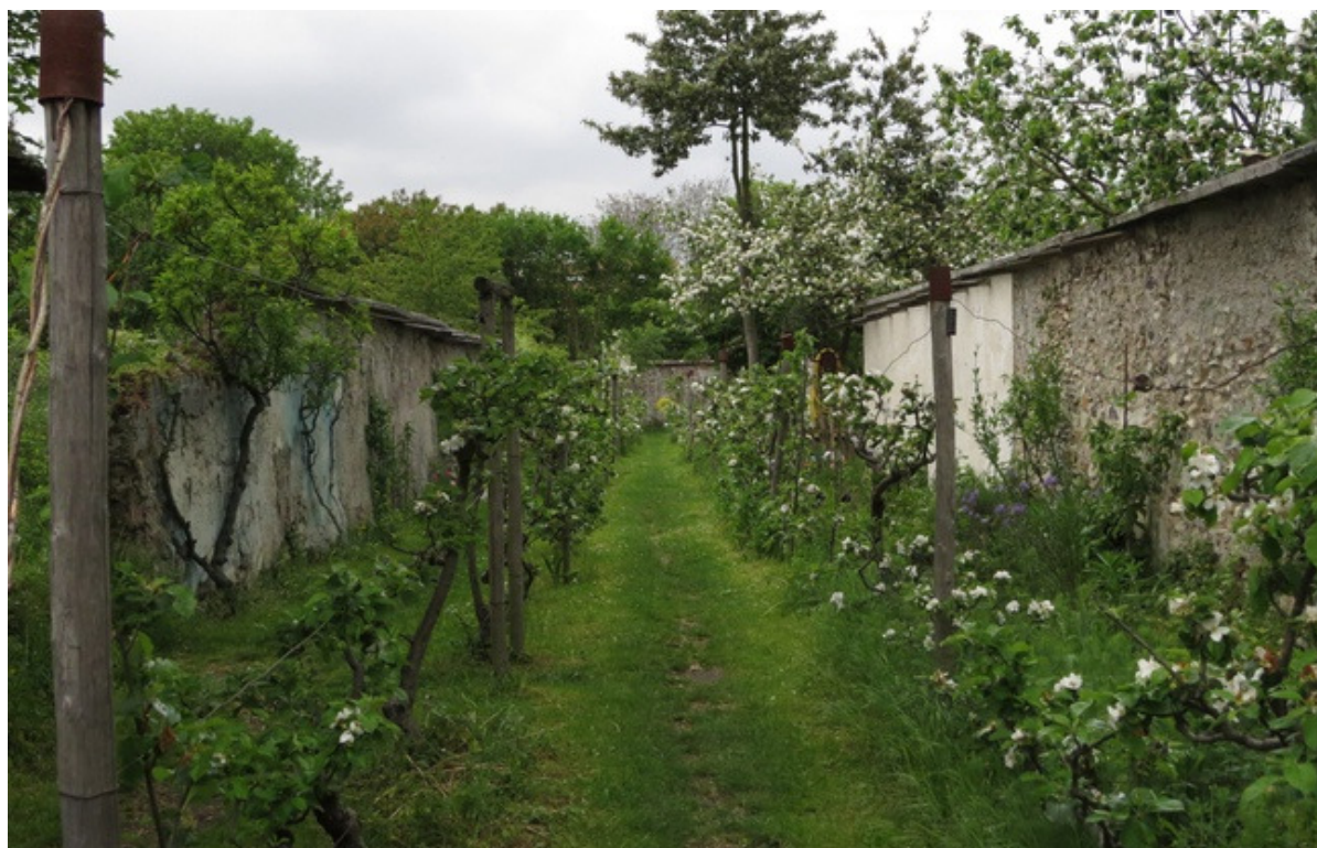
La parcelle des murs à pêches abrite l'un des plus beaux jardins du site.