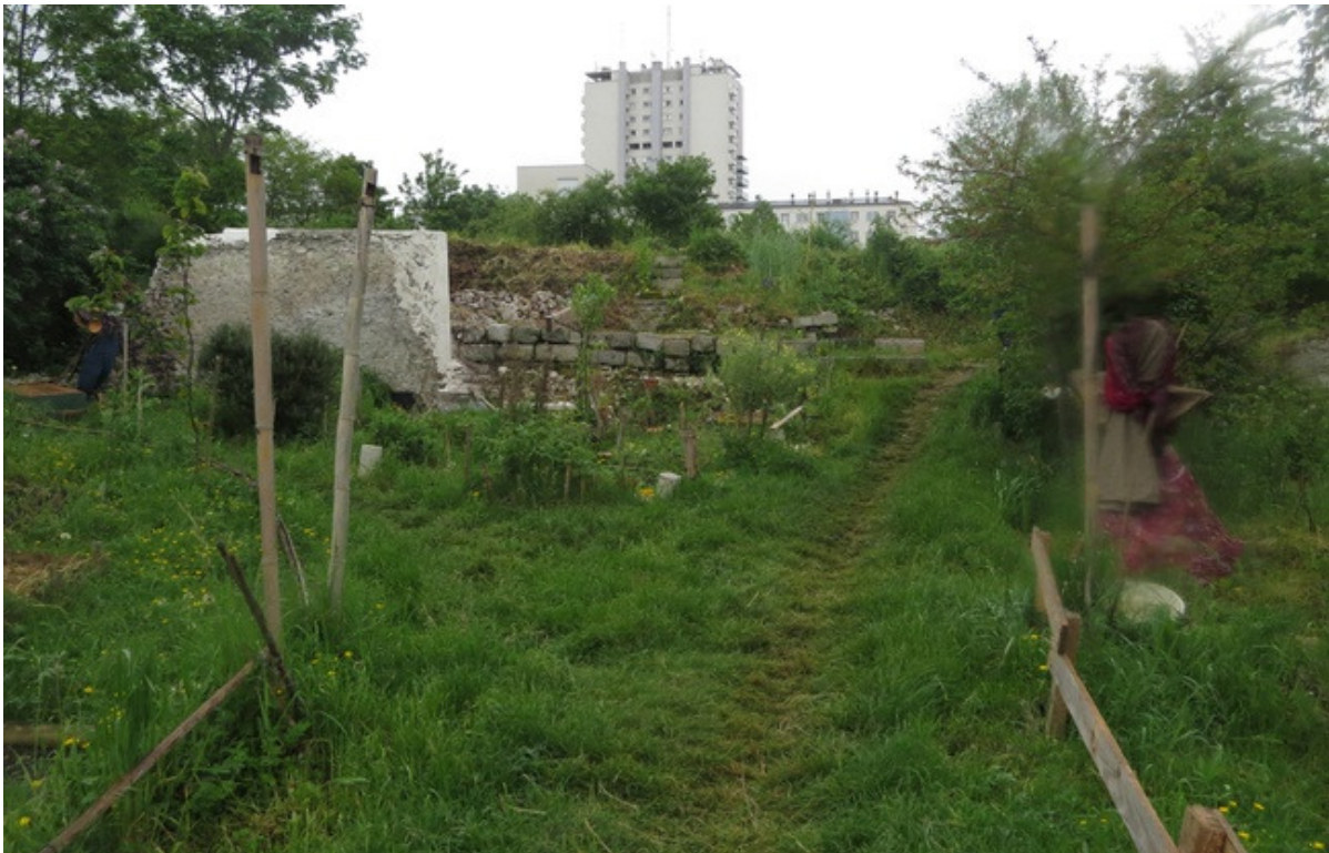
Le site des murs à pêches de Montreuil : une oasis au pieds des tours de béton. - 20minutes

Mais la vraie particularité du site se dévoile au fur et à mesure de notre progression dans ce labyrinthe fruitier, divisé entre plusieurs dizaines de parcelles : « Ici les murs sont au milieu des parcelles. Le mur n'est pas là pour séparer des espaces mais pour créer. En l'occurrence, des fruits », explique encore Hugo dans un sourire.