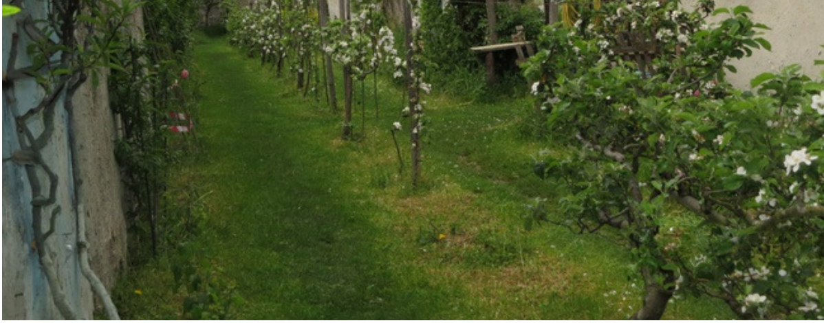
La parcelle